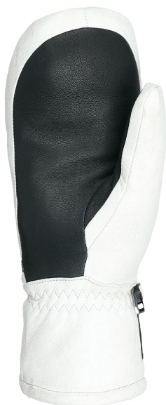
35 black white