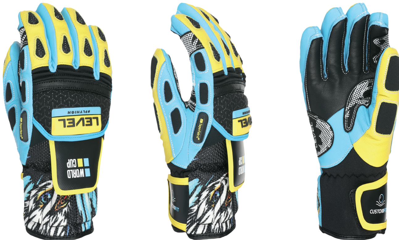
70 yellow blue