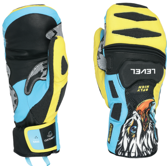
70 yellow blue