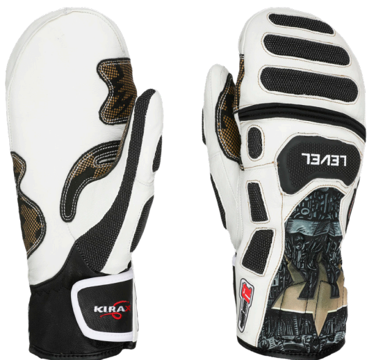
35 black white