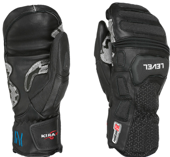
43 pk black

FIT: Natural MATÉRIEL: Cuir de chèvre imperméable, Superfabric, Paume en cuir de chèvre imperméable ISOLATION: Thinsulate, Doublure en laine avec traitement Polygiene POINTS FORTS: Protection des articulations, Système de stimulation Kirax VALEUR DURABLE: 60% Bio CARACTÉRISTIQUES: Sublimation au dos, Couture extérieure, Poignée en silicone, Couture en Dyneema, Superfabric, Ajustement personnalisé, Doublure en graphène, Doublure des doigts à l'intérieur, Durashield sur le revers du poignet