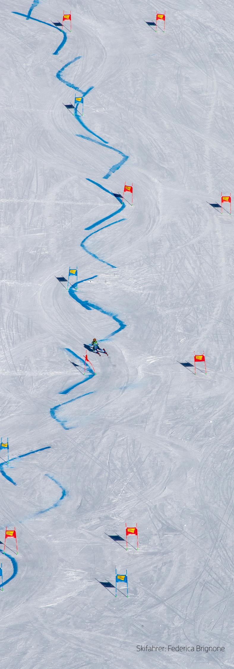
Skifahrer: Federica Brignone