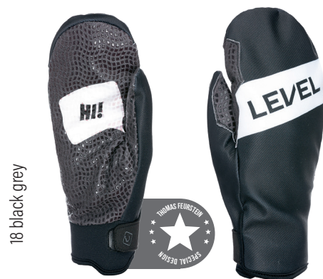
18 black grey