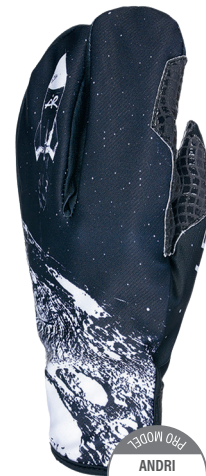
2000 OBI ANDRI RAGETTLI PRO MODEL