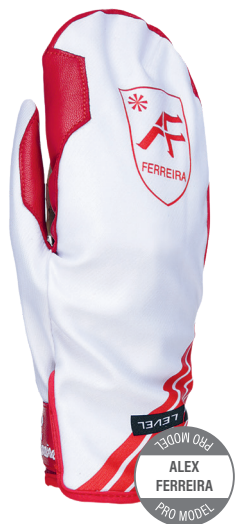
2000 OBI ALEX FERREIRA PRO MODEL