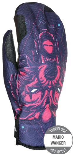
2000 OBI MARIO WANGER PRO MODEL