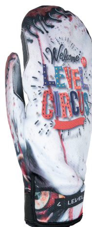
2361UM_40 pk white