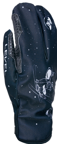
2361UT_43 pk black