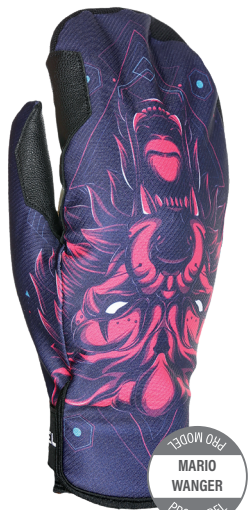
PRO MODEL MARIO WANGER