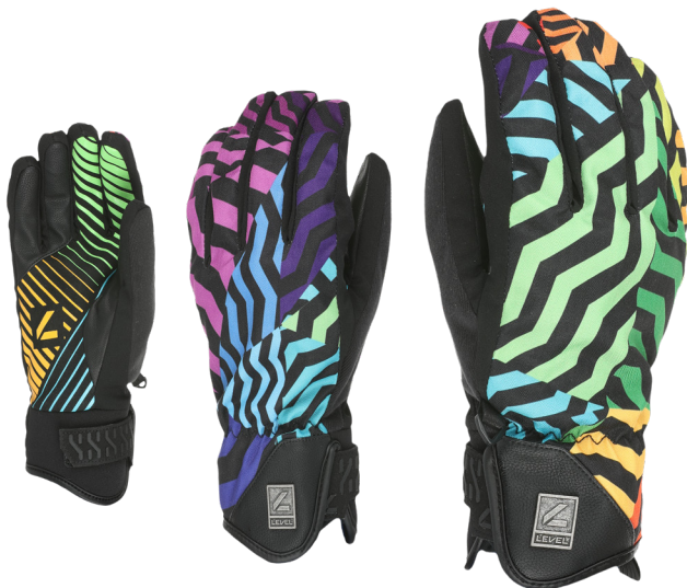
06 light blue

ISOLIERMATERIALIEN: Leichtes Fleece EIGENSCHAFTEN: Kurze Stulpe, Klettverschluss, Nasenreiniger, Sturmschleufe