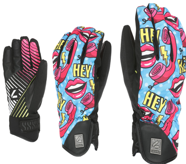
62 hot pink