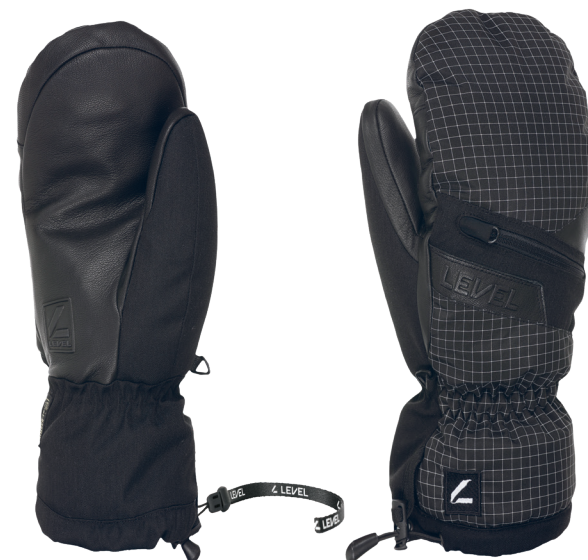
35 black white