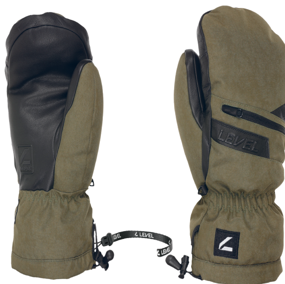
14 olive green